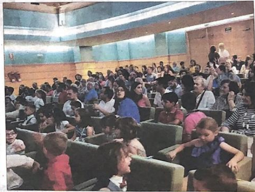
RODAJE. Los alumnos del CEIP Gloria Fuertes en el escenario del teatro Darymella durante el estreno del corto.